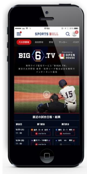
スマートフォン版

「BIG6.TV」Web サイト URL : https://sportsbull.jp/category/big6tv/