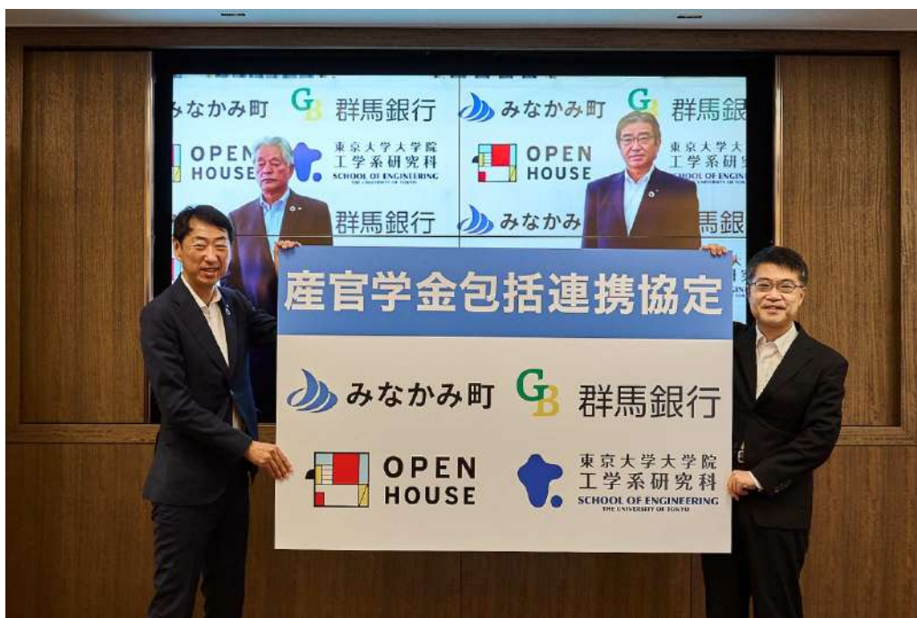
写真：包括連携協定